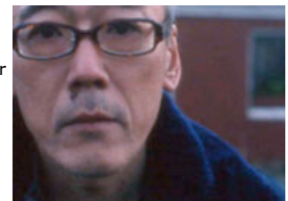
"Ai No Yokan" von Masahiro Kobayashi

Durch ihren Glamour oder ihre Originalität beeindrucken konnten die filmischen Gäste des 60. Jubiläumsfestivals in Locarno nur bedingt. So überrascht es auch kaum, dass der Goldene Leopard an einen Film ging, der sich durch seine formale und inhaltliche Strenge, seine Zurückgenommenheit und Konzentration auszeichnet, und der dadurch seine Radikalität erreicht. Der japanische Drehbuchautor, Regisseur und Komponist Masahiro Kobayashi übernimmt in seinem Film AI NO YOKAN (THE REBIRTH) auch eine der beiden Hauptrollen.