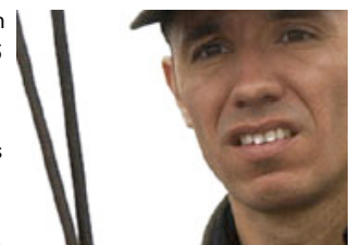
"Capitaine Achab" von Philippe Ramos

Erwähnenswert ist die Sektion „Open Doors“, die in diesem Jahr dem Nahen und dem Mittleren Osten gewidmet ist. 25 Lang- und Kurzfilme aus Ägypten, Israel, Irak, Jordanien, Libanon, Syrien und aus den palästinensischen Gebieten wurden dem Publikum präsentiert. Gleichzeitig wurden aus 120 eingereichten Projekten zehn ausgewählt und in Locarno potentiellen Koproduzenten vorgestellt. Vier der Projekte, darunter THANATOR und LE CHEMIN DES FIGUES sind außerdem mit 50.000 Franken bzw. 10.000 Euro gefördert worden, u.a. von der Direktion für Entwicklung und Zusammenarbeit (DEZA). Man wird sehen, ob diese Filme dann in den nächsten Jahren in Locarno zu sehen sein werden. In jedem Fall ist „Open