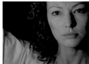
"Phantom Love" von Nina Menkes

In eine sinnlich-mystische Welt entführt der ungarische Regisseur Benedek Fliegau den Zuschauer in seinem Film TEJÚT (MILKY WAY). Ein gutes Dutzend Orte, die in präzisen, tableau-artigen Einstellungen fotografiert wurden. Jede Einstellung ist eine eigene Plansequenz, in der sich die Protagonisten seltsamen, manchmal gar absurden Handlungen widmen, eine Art Tableau Vivant. Fliegau komponiert seine Bilder sorgfältig genau, und achtet auch beim Ton auf jedes einzelne Detail. Fliegau: „TEJÚT ist ein besonderer Film, in dem man anstelle von Giraffen und Pinguinen den Menschen zuschauen kann.“ Beide Filme waren in der Sektion „Compétition Cinéaste du présent“ zu sehen.